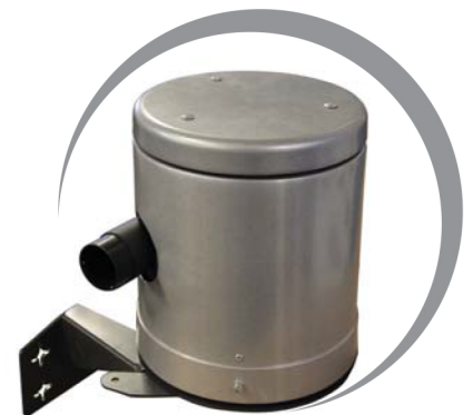
Sistema di carico automatico pellet completo di centralina di controllo, sensori di livello, presa prodotto, caricatore e aspiratore pneumatico.