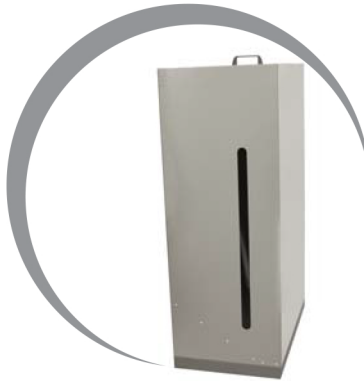
Serbatoio supplementare per combustibile pellet, costruito in lamiera zincata completa di coclea di estrazione.